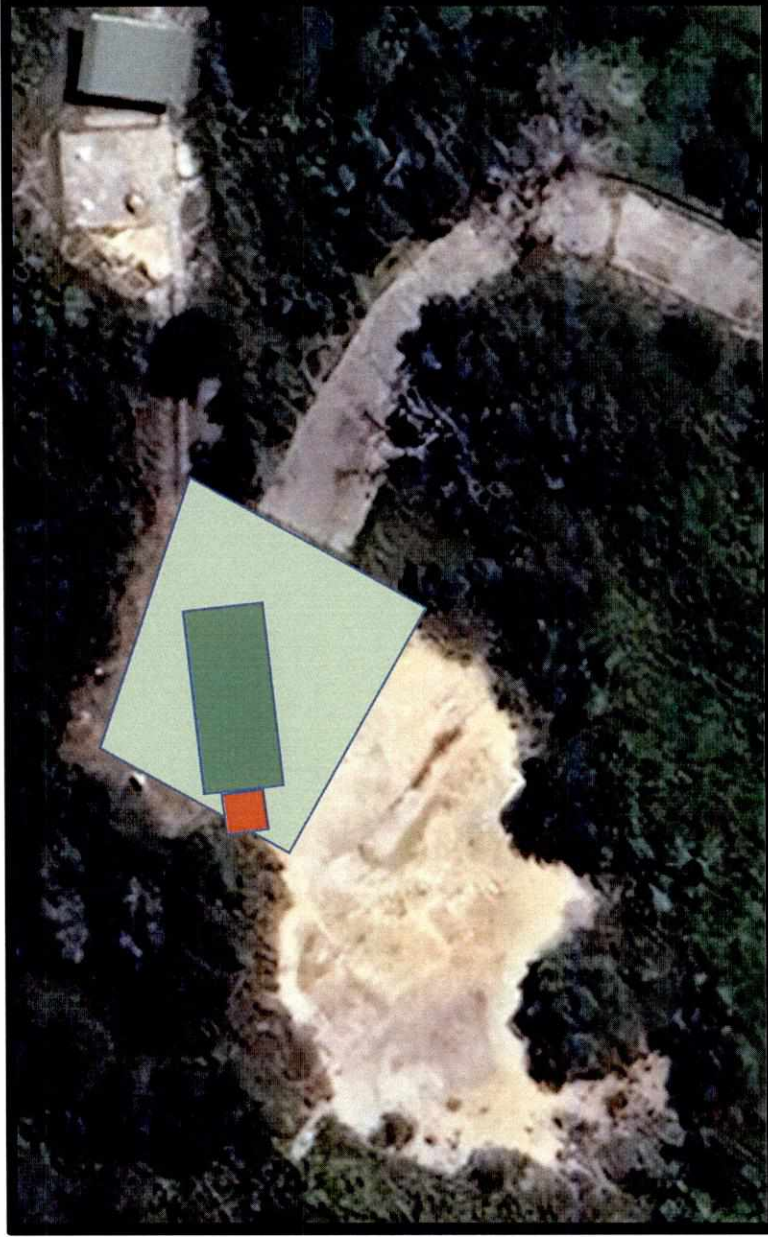
Figure 3 Area simin , garaj dan tangki air