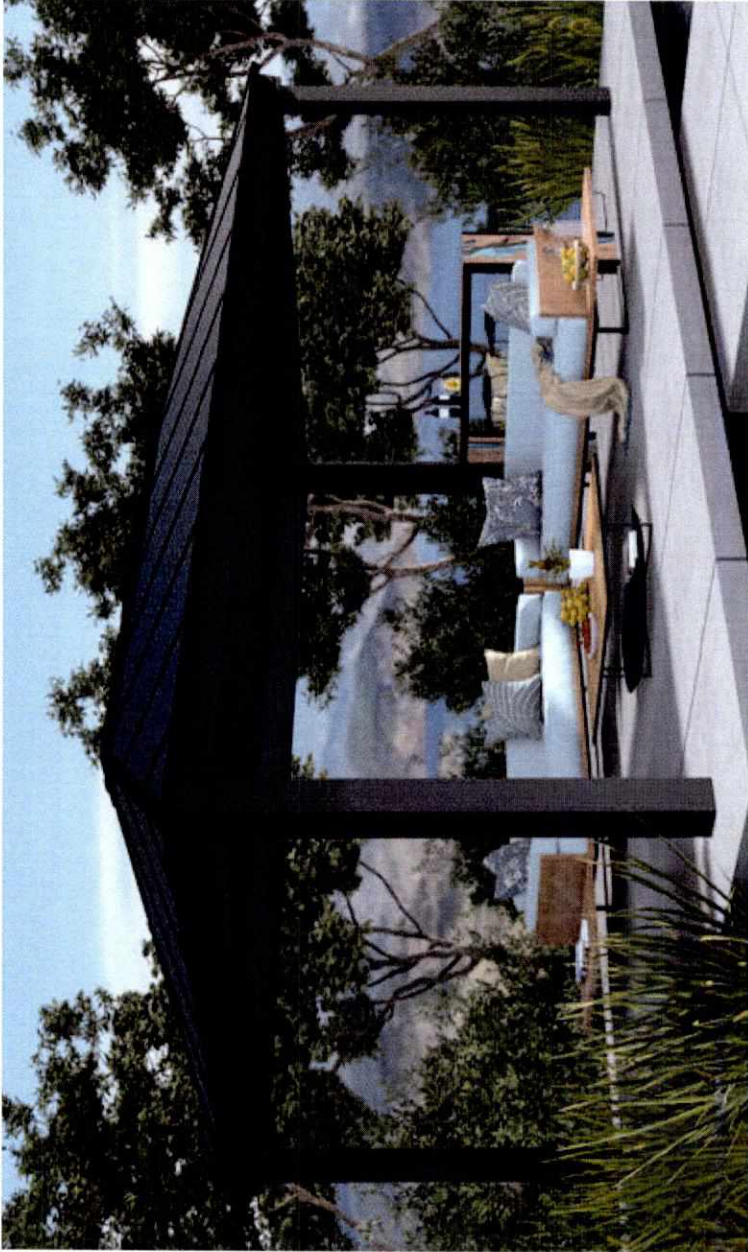
Figure 4 CONTOH ATAP GARAJ